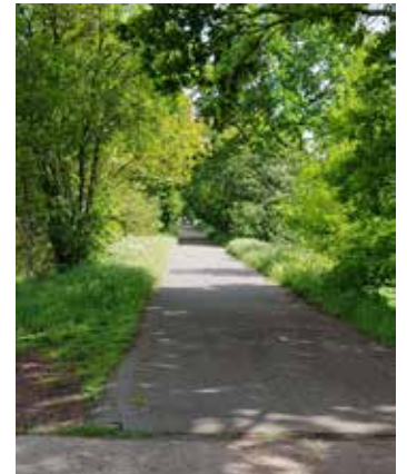
▲ Het fietspad tussen Lokeren en Eksaarde krijgt in het natuurgebied een fluorescerend wegdek.

Om het dossier te deblokken, lanceerden we in ons verkiezingsprogramma het idee van een fluorescerende verflaag. Goedkoop, snel te verwezenlijken en perfect conform de wetgeving. En veel beter dan zeven jaar niets doen of blijven discussiëren. N-VA-kandidaat Manu Diericx bracht dat voorstel nog eens ter sprake tijdens het verkiezingsdebat. We zijn dan ook blij dat de meerderheid erop ingaat en er eindelijk iets gebeurt in dit aanslepende dossier.