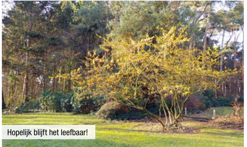
Hopelijk blijft het leefbaar!

De bestemming van de gronden staat als een paal boven water. Bijkomende maatregelen kunnen ervoor zorgen dat er een evenwicht ontstaat tussen de woningen en de natuur. Overleg is dus van groot belang.