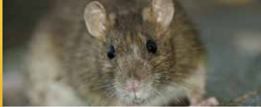
N-VA pleit voor bestrijding rattenplaag (p. 2)