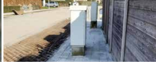
Hou rekening met minder mobiele mensen! (p. 3)